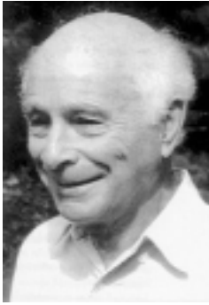
Е.С. Whitmont в последние годы жизни